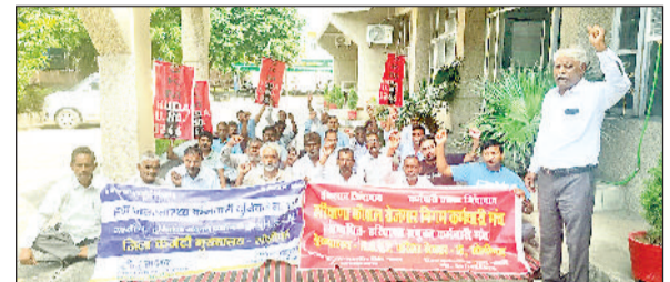
सोनीपत। एचएसवीपी कर्मचारियों विरोध प्रदर्शन करते हुए।