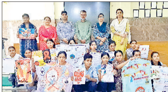
खरखोदा। प्रतियोगिता में बनाए पोस्टरों को दिखाते हुए छात्राएं।