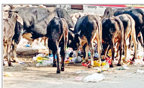
गन्नौर। सड़क किनारे कूड़े में विचरण करते गोवंशों का झुंड।

शहर की गलियों और सड़कों पर भटक रहे बेसहारा गोवंश से जल्द ही लोगों को राहत मिलने वाली है। नगरपालिका की ओर से लगाए गए टेंडर को अब खोल दिया गया है। एजेंसी से मोलभाव कर लिया गया है अब आगे की प्रक्रिया पूरी होने के बाद टेंडर एजेंसी को अलाट कर दिया जाएगा। गन्नौर की गोशालाओं में पहले से ही जगह पूरी तरह भर चुकी है, जिस कारण बेसहारा गोवंश गलियों और सड़कों पर भटक रहे हैं। यह न केवल यातायात के लिए परेशानी का कारण बन रहे थे, बल्कि लोगों की सुरक्षा और सफाई व्यवस्था