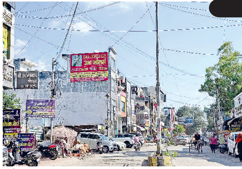
सोनीपत। कच्चे क्वार्टर में साफ आसमान और कड़ी धूप का दृश्य।